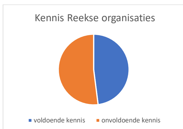
Grafiek 1. Kennis Reekse organisaties